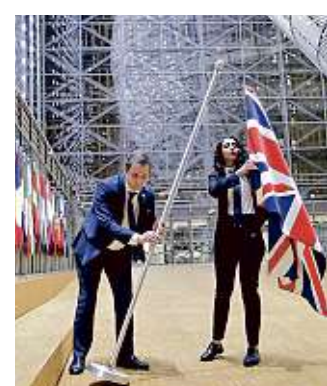
La bandera del Reino Unido fue retirada ayer de la sede de la Unión Europea.

"Existen elementos, al menos en grado de presunción, por la posible comisión de actos ilegales y actos de corrupción de dicho Magistrado, lo que resulta indispensable investigar para garantizar una justicia imparcial y aplicada con apego irrestricto a lo que ordena la ley", agrega.