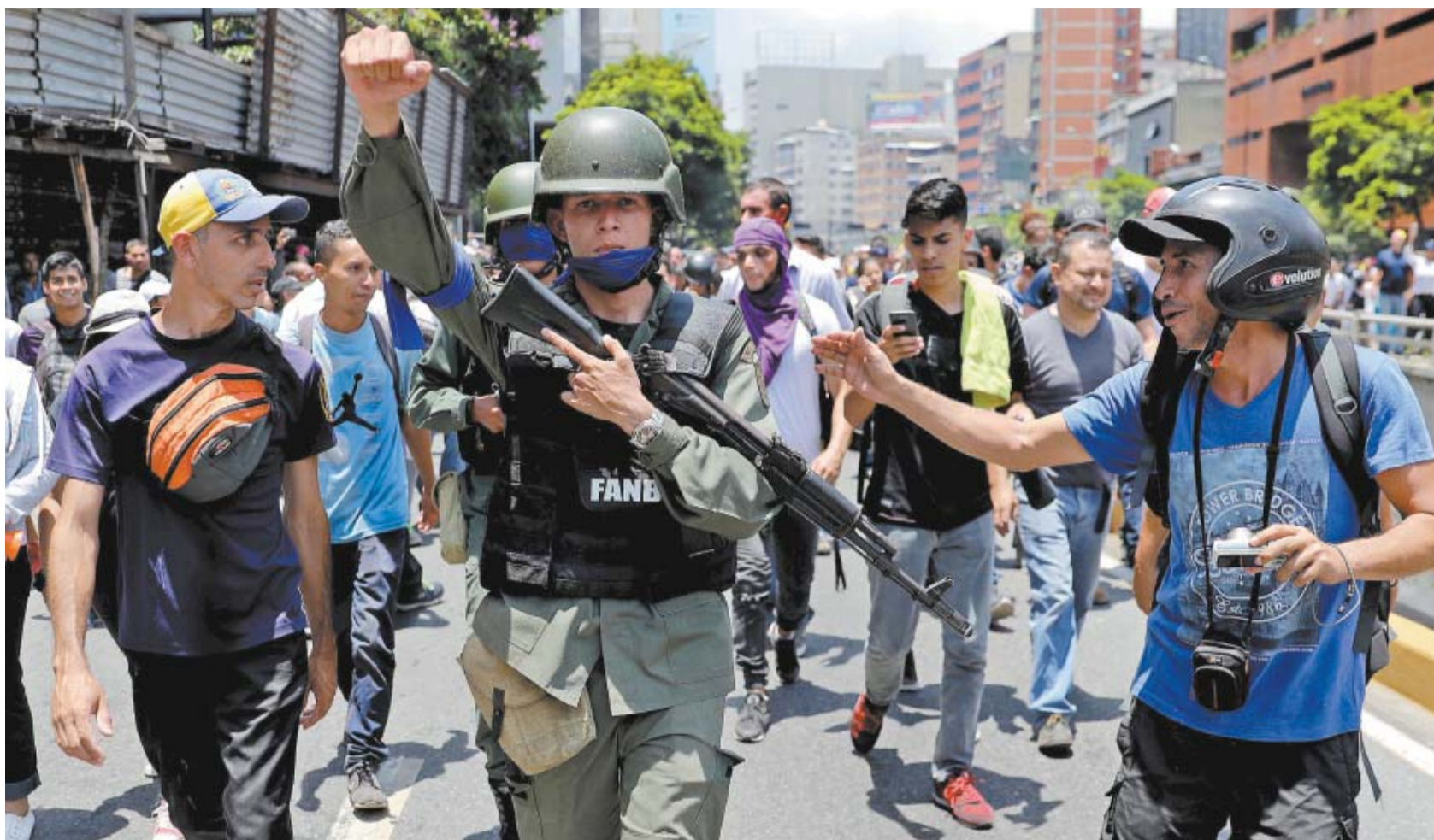
Un grupo de militares se rebeló contra el régimen de Maduro para brindar su apoyo al líder opositor Guaidó en las manifestaciones de ayer en Caracas.