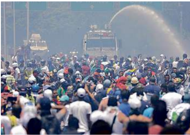
Tanquetas del Gobierno trataron de dispersar a los simpatizantes de Guaidó.