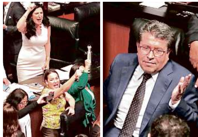
Mientras panistas celebraron que la reforma fue regresada a San Lázaro, Monreal lamentó esa decisión.

“Un dato que seguramente no han analizado: en el dictamen se prohíbe que se compren vehículos hasta por 360 mil pesos. ¿Saben cuánto era lo permitido en la pasada administración? 275 mil, o sea, ahora pretenden que el Gobierno pueda comprar vehículos de mayor costo. ¿Dónde queda la austeridad señores?”, cuestionó.