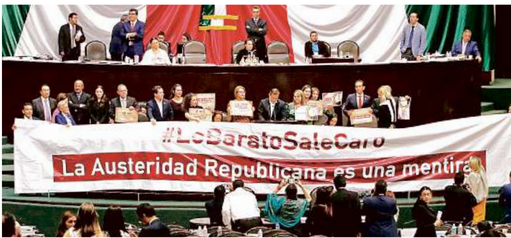
Diputados del PRI protestaron durante sesión en la que fue aprobada la Ley de Austeridad.

“Los ahorros generados como resultado de la aplicación de dichas medidas de-