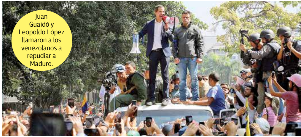
Juan Guaidó y Leopoldo López llamaron a los venezolanos a repudiar a Maduro.

En un mitin en Caracas, ambos llamaron a los venezolanos a salir a las calles en todo el país para "conquistar la libertad".