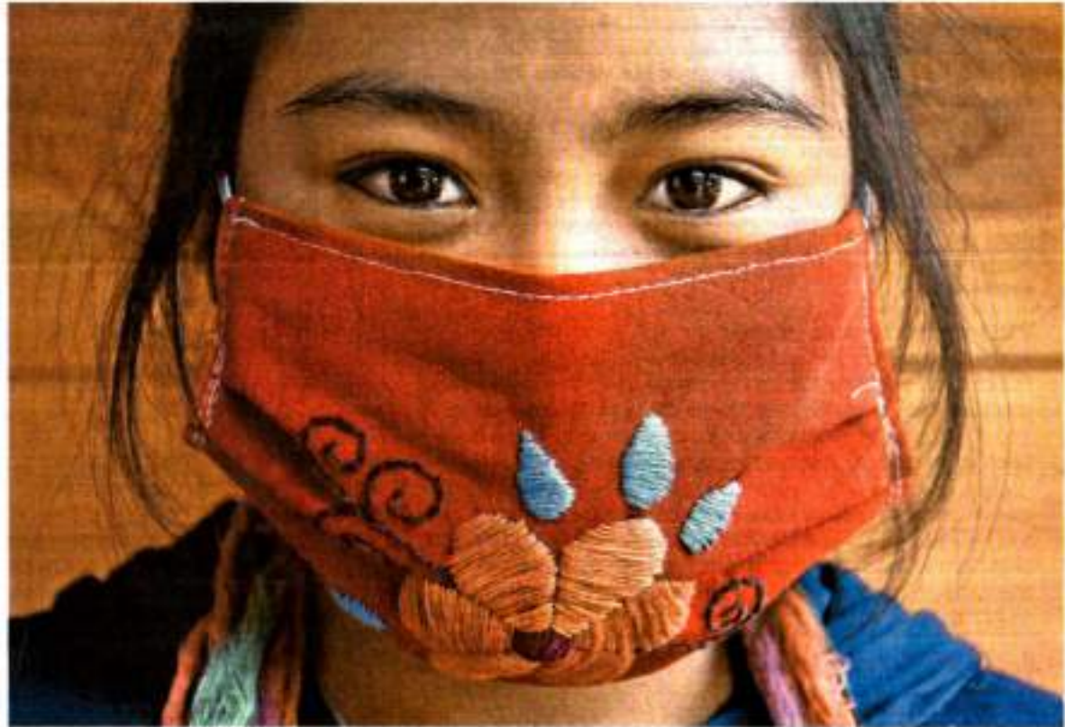
Las artesanas chiapanecas tardan un promedio de dos horas en elaborar un cubrebocas bordado.