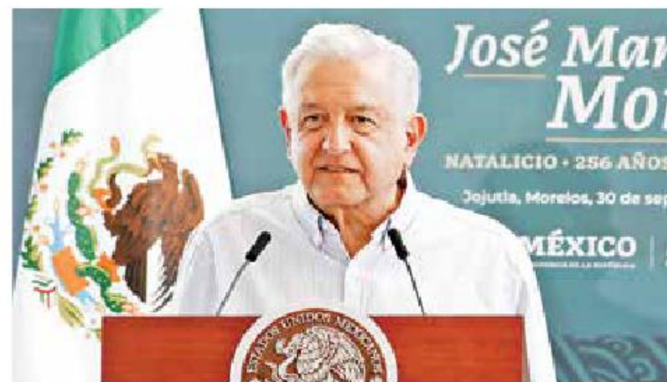
La actual política educativa en México está guiada por los Sentimientos de la Nación, aseguró el presidente López Obrador.

"Hay voluntad política para conocer todo lo relacionado con el lamentable caso de Ayotzinapa. Hay instrucciones para que no se oculte información, que no se proteja a nadie. Están ayudando todas las instituciones del gobierno federal. Está ayudando la Secretaría de