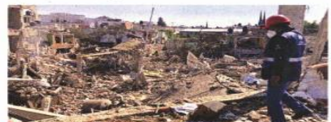
Protección Civil evaluó los daños materiales provocados por tres explosiones subsucuentes en un ducto ordeñado.