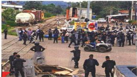
El desalojo de vías férreas en Michoacán ocurrió hasta que Morena asumió la Gubernatura.

Los profesores integrantes de la CNTE, que recibieron los depósitos el sábado,