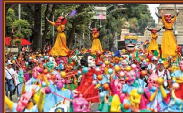
En el desfile participaron mil voluntarios, 150 músicos, 12 carros alegóricos, cuatro artistas invitados y 61 vehículos empujables.