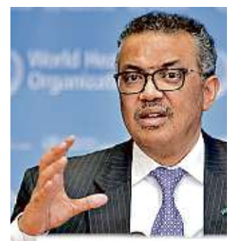
Tedros Adhanom, jefe de la OMS.

“Ya lo hemos dicho: es importante usar cubrebocas, lavarse las manos, y esperamos que los líderes sean modelos”. México suma un millón