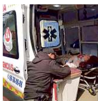
La madre del joven quedó herida tras el ataque.

El doble homicidio ocurrió la mañana de ayer al interior del domicilio donde vivían, en la Colonia San Francisco Cuautliquixca. Según reportes de las autoridades, Braulio salió a la calle y regresó a su casa a las 10:10 horas.