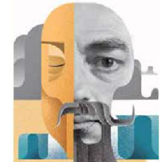
Ilustración: Horacio Sierra