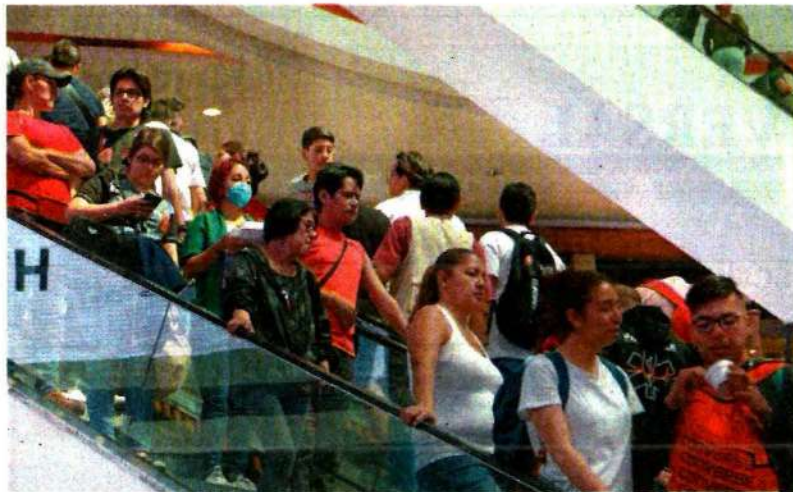
Ayer los capitalinos salieron a disfrutar el espacio público sin preocuparse.