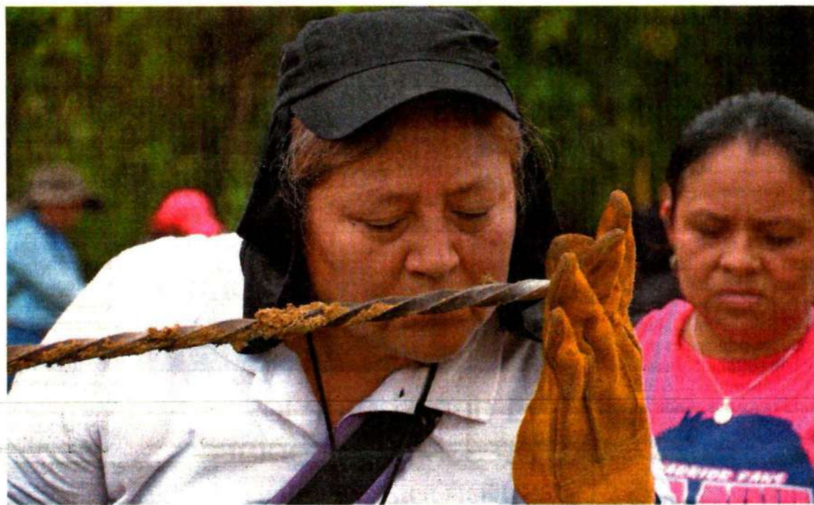
Una integrante de la Quinta Brigada Nacional de Búsqueda de Personas Desaparecidas olfatea una varilla tras hundirla en la tierra, en busca de algún indicio que lleve a encontrar al menos los restos de sus familiares.