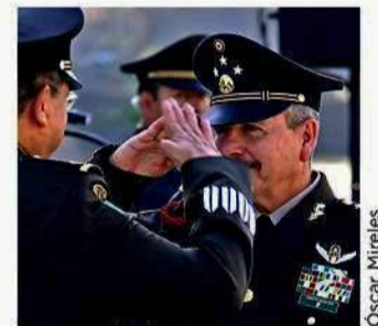
■ Nuevo subsecretario.