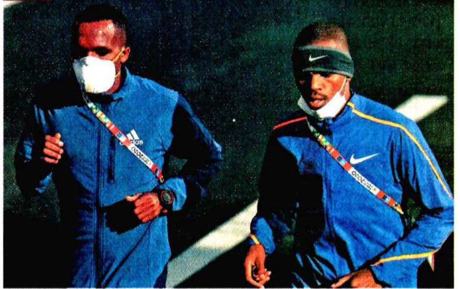
Participantes en la maratón de Tokio 2020 usaron mascarillas para evitar contagios.