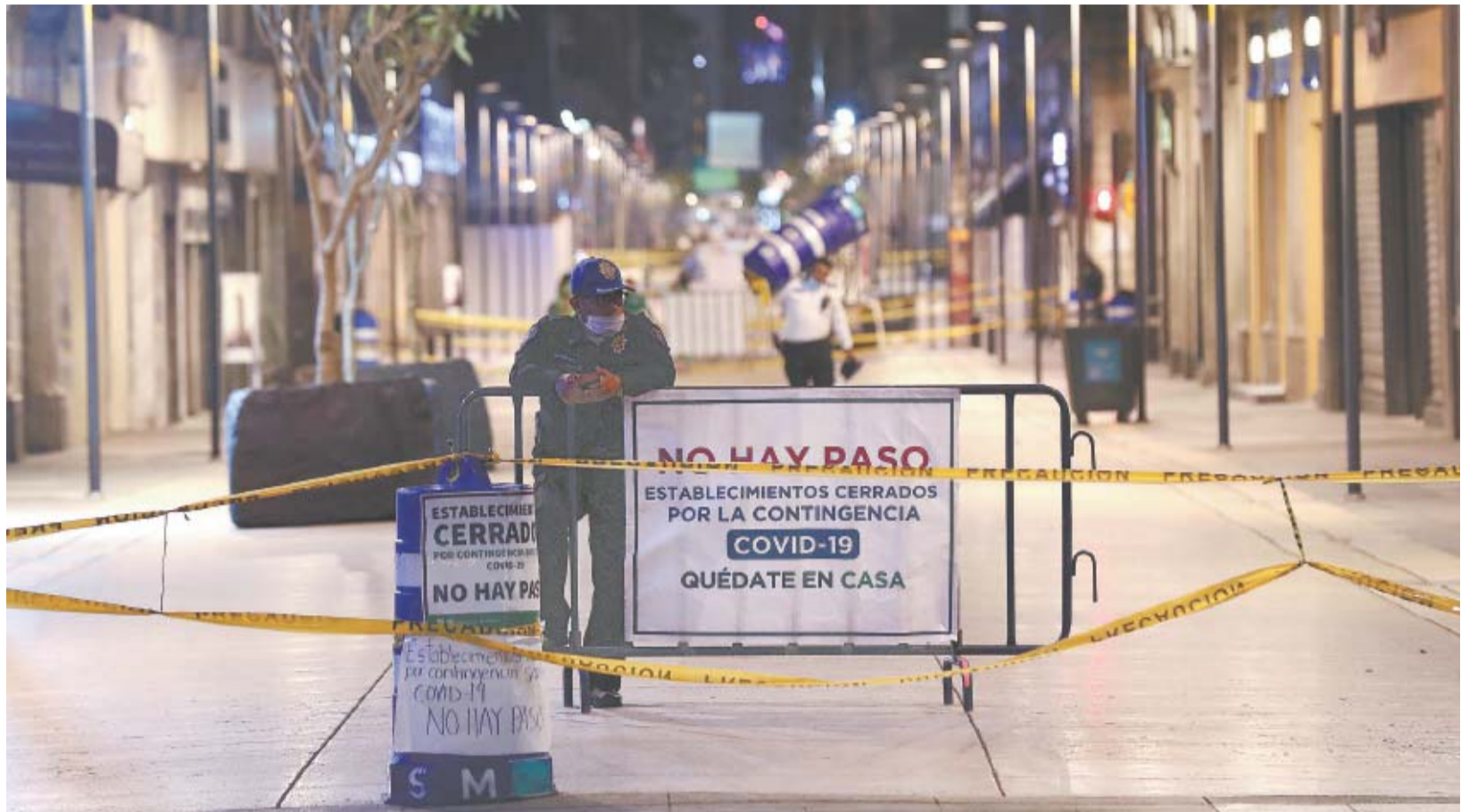
VALENTE ROSAS - EL UNIVERSAL

Para desincentivar a los ciudadanos de salir de sus casas durante la emergencia sanitaria por el Covid-19 y evitar contagios, el gobierno de la Ciudad de México acordó la calle Madero y el Zócalo para enviar el mensaje de que el Centro Histórico está cerrado, pero no se prohíbe el paso. En un recorrido de este diario por las plazas comerciales de la ciudad, se registró que 90% de los locales acataron la indicación de las autoridades y bajaron las cortinas. METRÓPOLIA18