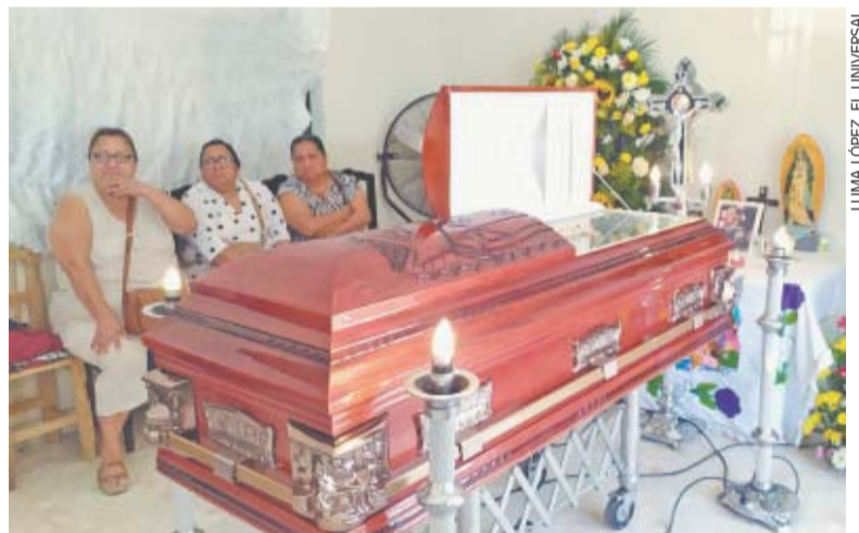
LUMA LÓPEZ. EL UNIVERSAL

● Al menos una persona ha muerto en el Hospital Regional de Pemex de Villahermosa por un medicamento contaminado, de acuerdo con la petrolera. Familiares de los pacientes reportan más víctimas. A25