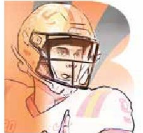
Ilustración: Horacio Sierra