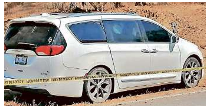
Los cuerpos de los uniformados fueron abandonados dentro de una camioneta.