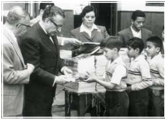
Entrega de libros de texto gratuitos a estudiantes.

Sin desestimar logros como la notoria reducción del analfabetismo, expertos opinan que la educación aún no es el gran igualador social al que aspiraba José Vasconcelos en 1921. / 10-13