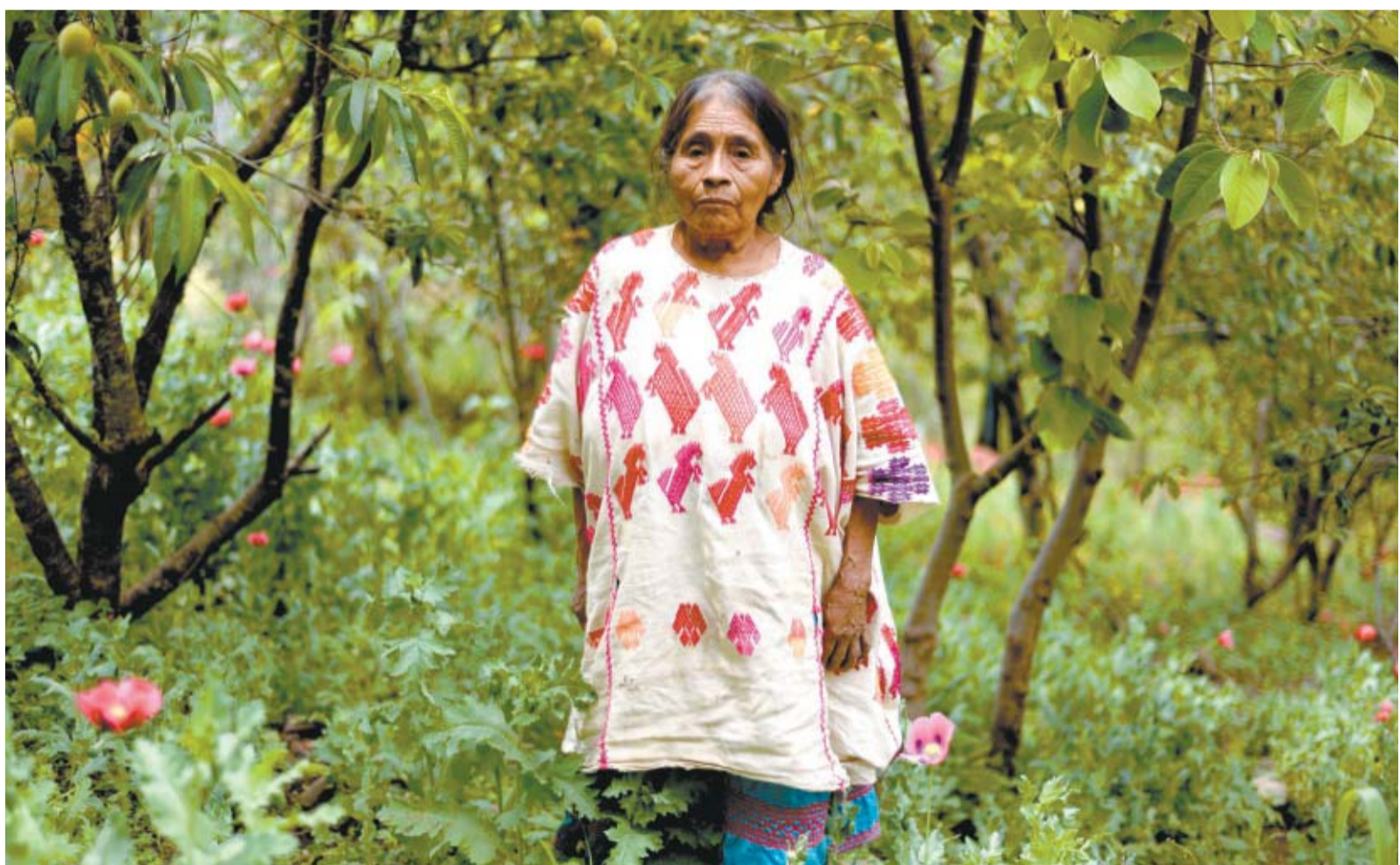
La caída del precio de la goma del opio ha provocado estragos en pueblos de Guerrero que tenían como sustento los cultivos de amapola.