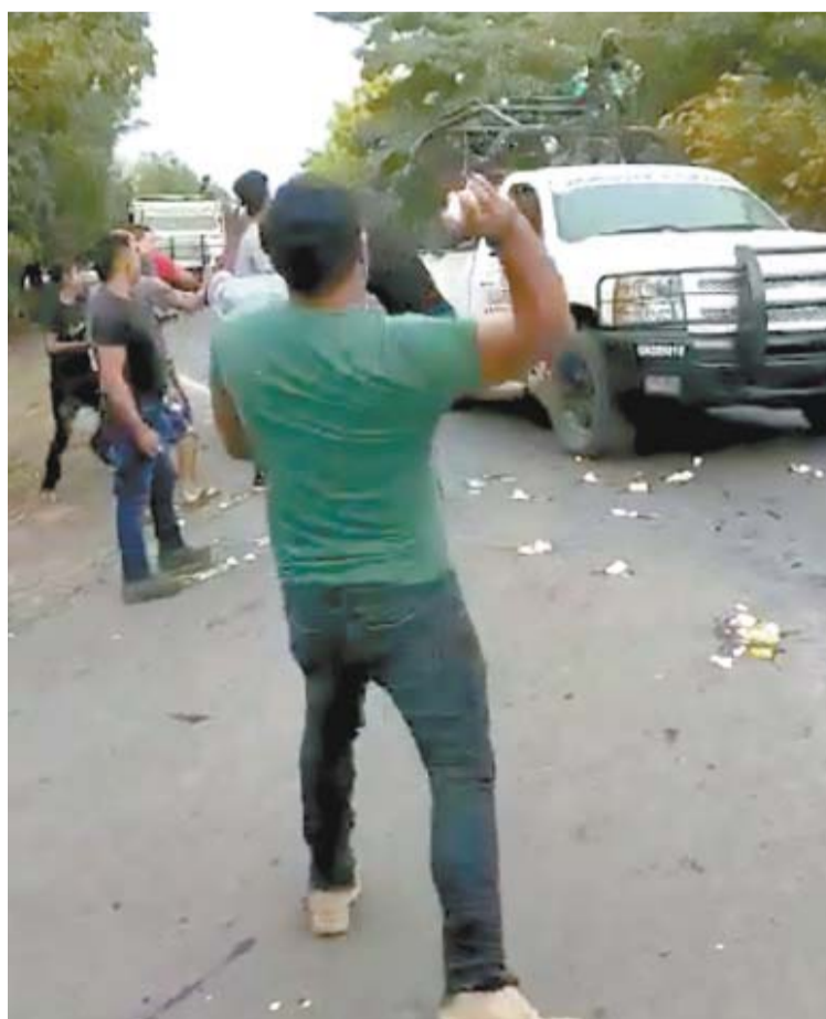
TOMADA DE VIDEO