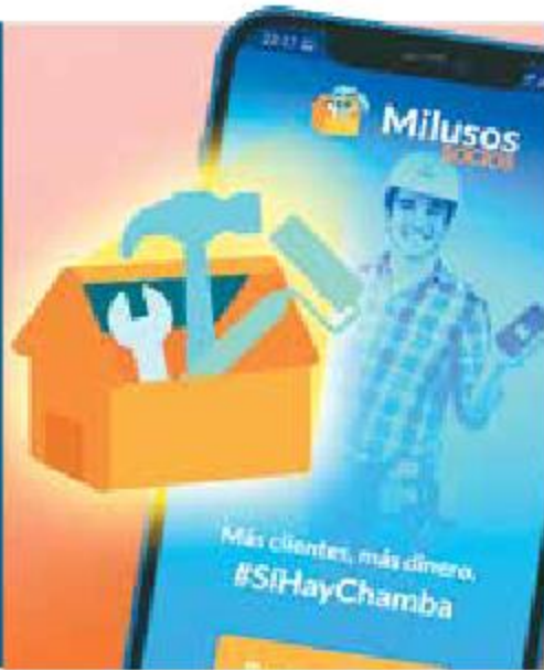
Fotoarte: Jesús Sánchez

Milusos es una app mexicana que ayuda a encontrar trabajadores especializados en plomería, carpintería, cerrajería, etc. DINERO | PÁGINA 7