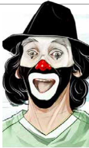
Ilustración: Horacio Sierra