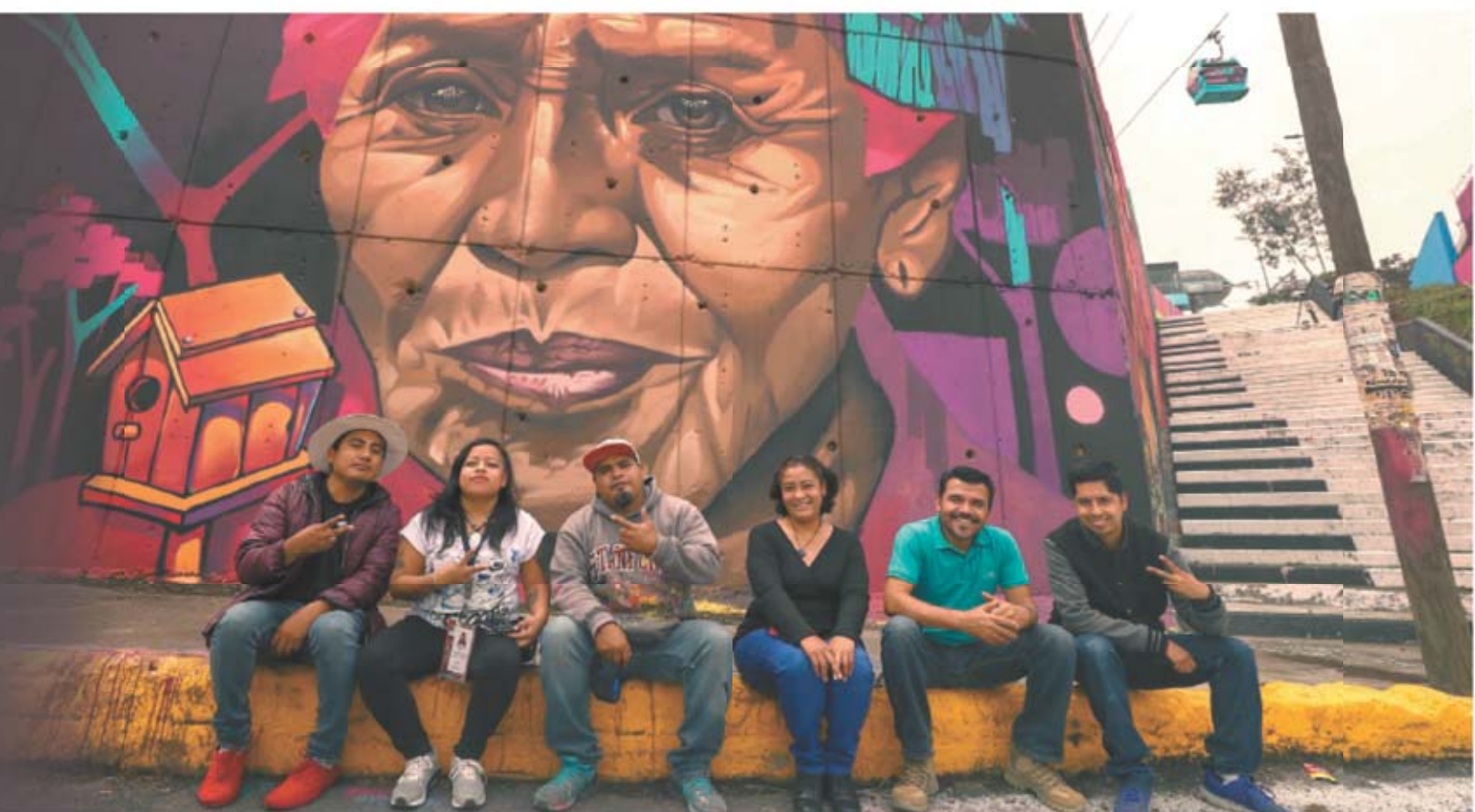
Diego Simón Sánchez, El Universal