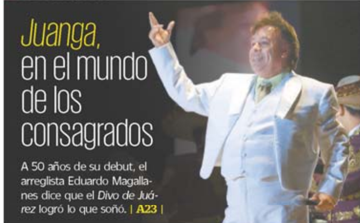
Pablo Salazar, Clarín