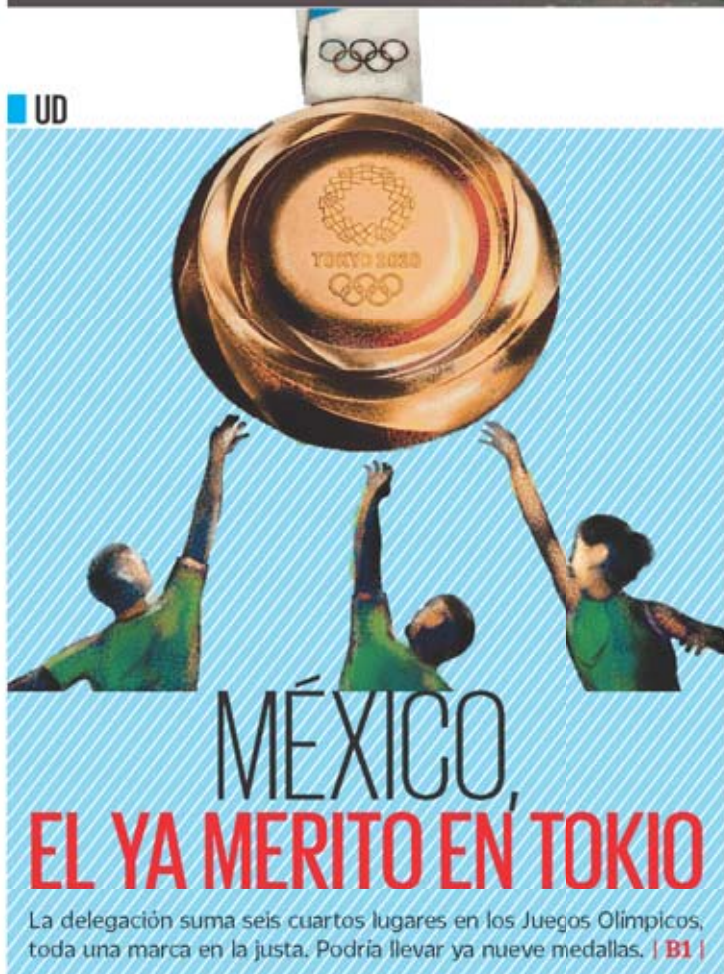
Dante de la Vega, El Universal