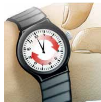
Ilustración: Horacio Sierra