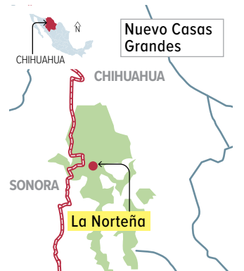
Gráfico: Erick Zepeda