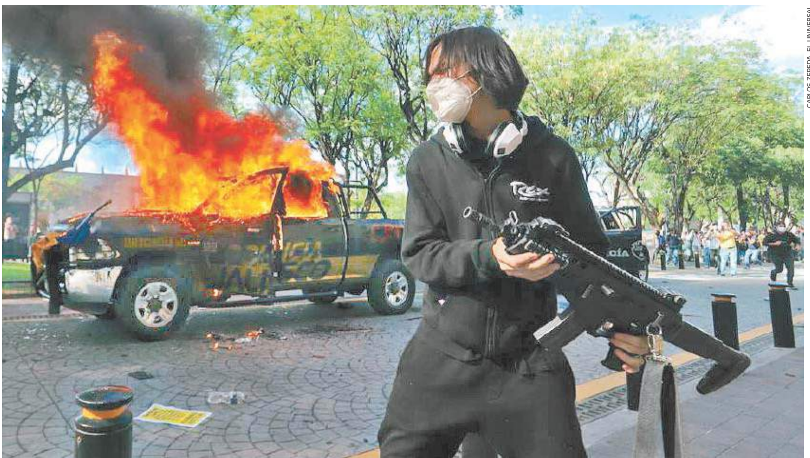
La primera manifestación para protestar por la muerte de Giovanni López, presuntamente a manos de policías municipales, se tornó violenta.