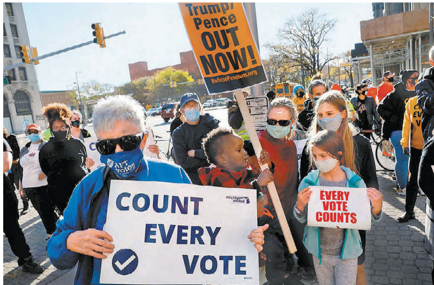
Las protestas replicadas en diversos estados, en exigencia de que se cuenten todos los votos, encaminan el proceso a tribunales.