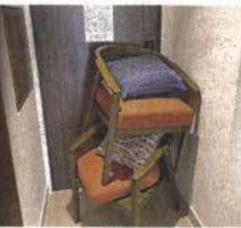
A los turistas se les pidió refugiarse en sus habitaciones y reforzar las puertas.