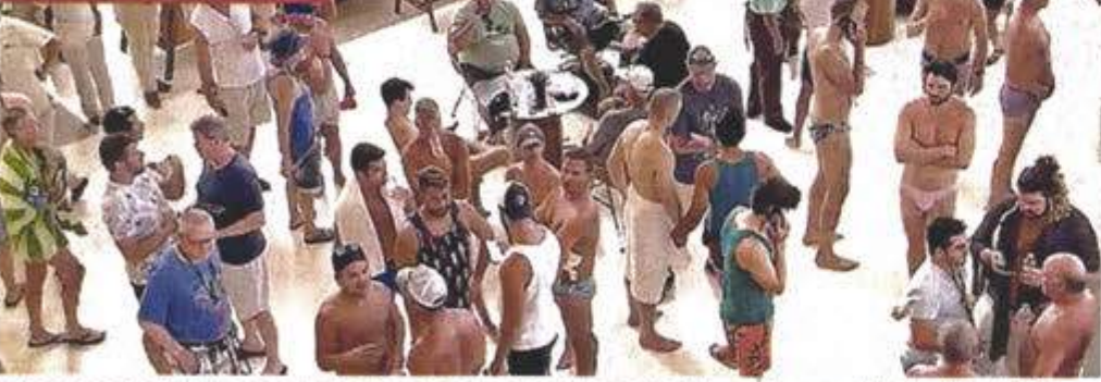
Decenas de turistas y empleados se resguardaron en el lobby y sótanos del hotel Hyatt Ziva.