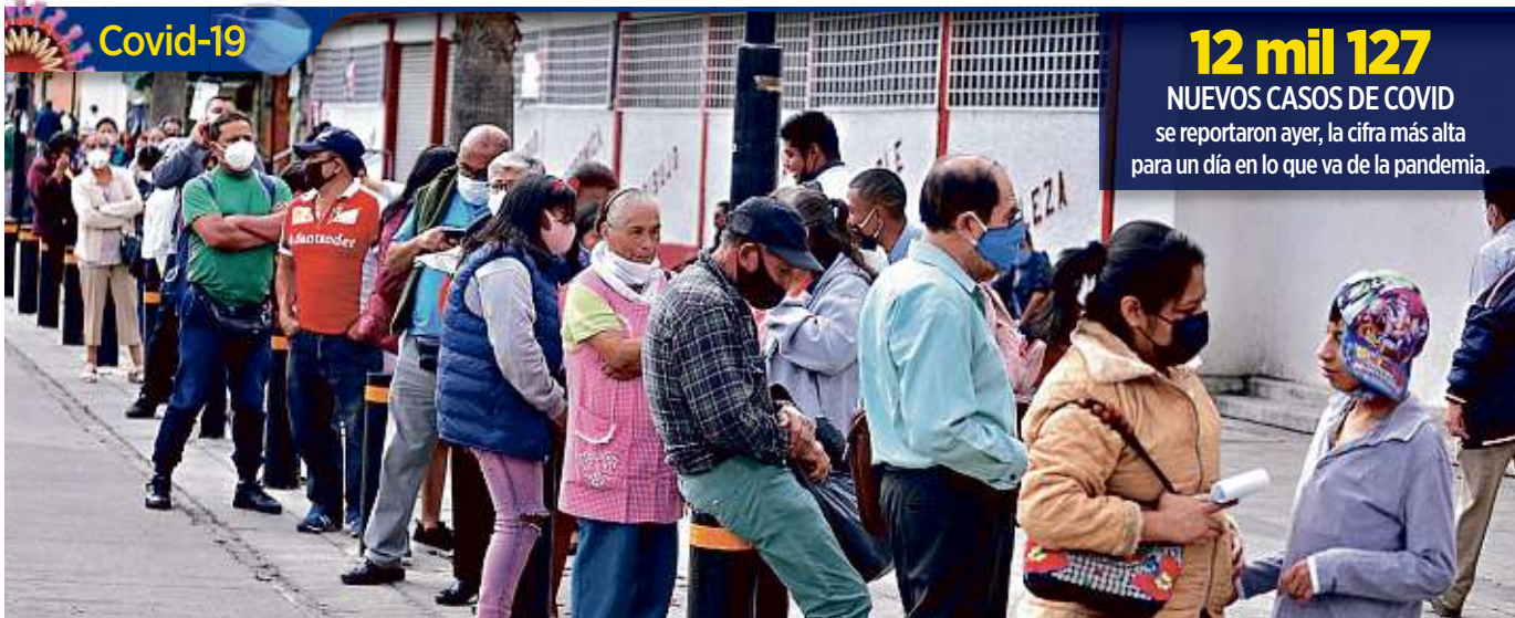
■ Sin sana distancia, decenas de personas hicieron fila afuera de un banco en Calzada de Guadalupe, en Gustavo A. Madero.

José Antonio Álvarez, investigador de la UNAM y experto en política criminal, advirtió que con el deterioro económico y social por la crisis actual, hay mayor riesgo de que grupos delictivos recluten a menores.