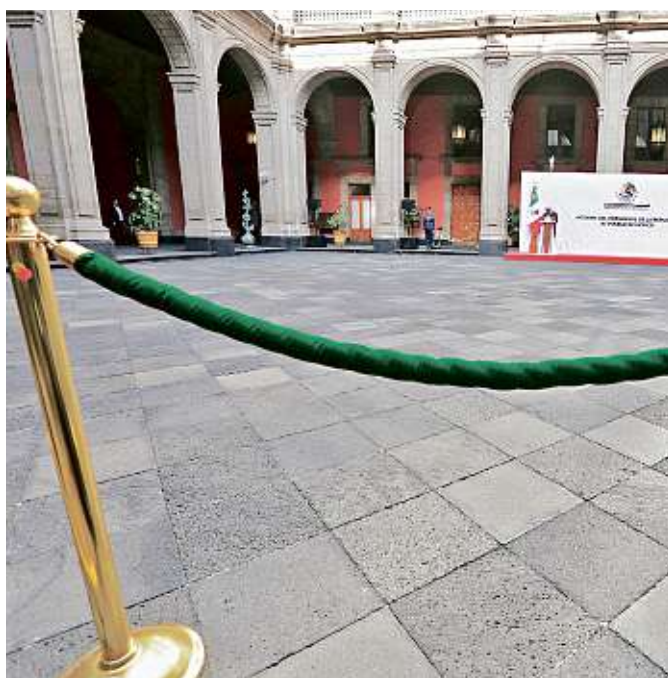
EN SOLEDAD. Desde el patio central de Palacio Nacional, el Presidente rindió ayer un “informe” durante 52 minutos.

“En este momento de crisis, posponer decisiones es en sí una mala decisión. Cada día perdido se traduce en un mayor daño para las familias mexicanas. El Presidente de México cuenta con nosotros en su proyecto de vencer a la corrupción, a la pobreza extrema, a la inseguridad y a la crisis del Covid-19. Pero también salvemos juntos los empleos y los ingresos de las