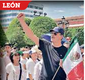
En más de una decena de ciudades, críticos del Presidente salieron a las calles a manifestarse.