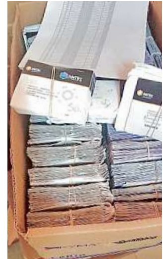
Miles de monederos electrónicos sin fondos fueron encontrados en la GAM.

En camionetas con falsos logos de Gobierno de la CDMX, trabajadores del megadesarrollo Mitikah talaron los árboles del camellón de la calle Real de Mayorazgo y fueron detenidos.