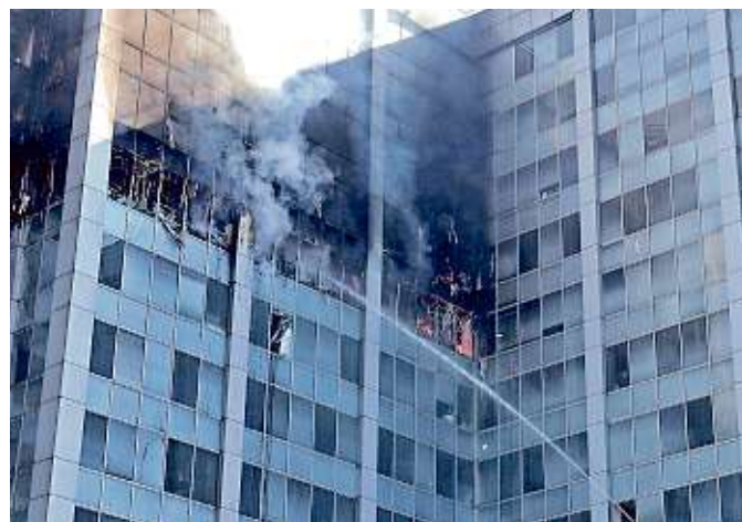
Un corto circuito causó el incendio, según el peritaje.

También se pueden hacer requerimientos a las personas físicas o morales, en términos de las disposiciones fiscales, para que exhiban y