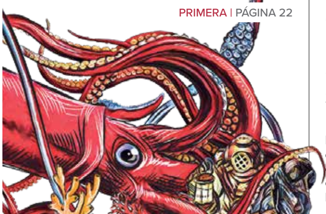
Ilustración: Jesús Sánchez