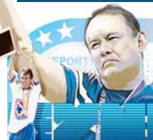
Ilustración: Horacio Sierra