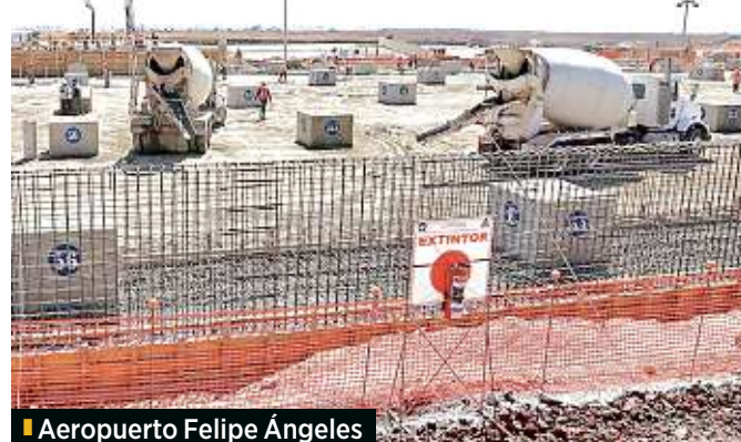
■ Aeropuerto Felipe Ángeles

■ “Aquellas empresas de producción de acero, cemento y vidrio que tengan contratos vigentes con el Gobierno federal, continuarán las actividades que les permitan cumplir con los compromisos de corto plazo exclusivamente para los proyectos de Dos Bocas, Tren Maya, Aeropuerto Felipe Ángeles, Corredor Transmexicano”.