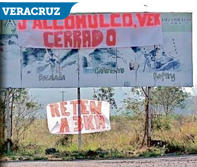
■ En Sabinas, NL, la puerta de un hospital para atender pacientes de Covid fue vandalizada. Y en Campeche y Veracruz, los pobladores instalaron retenes para impedir el paso a visitantes.