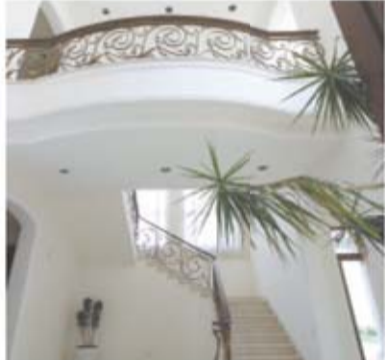
Al entrar a la residencia de dos pisos se observan unas escaleras.

Considera que en todo el espacio sólo hay tres construcciones con valor cultural e histórico: la residencia Lázaro Cárdenas (que también modificó Peña Nieto), los restos del antiguo acueducto y el edificio del Molino del Rey.