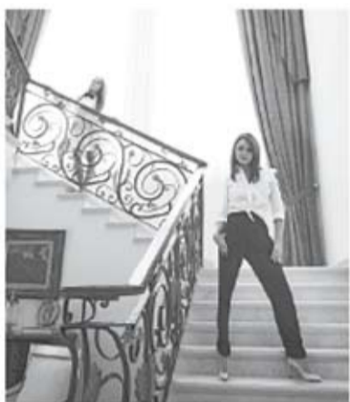
En este lugar posaron Rivera y Sofia Castro para la revista Marie Claire.