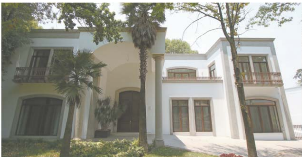
Fachada de la casa de oficinas de la entonces primera dama Angélica Rivera en Los Pinos, la cual fue edificada sobre una de las cabañas que Vicente Fox había construido y en la que vivían sus hijos.