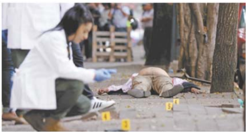
Peritos de la procuraduría revisaron la escena donde el atacante murió.