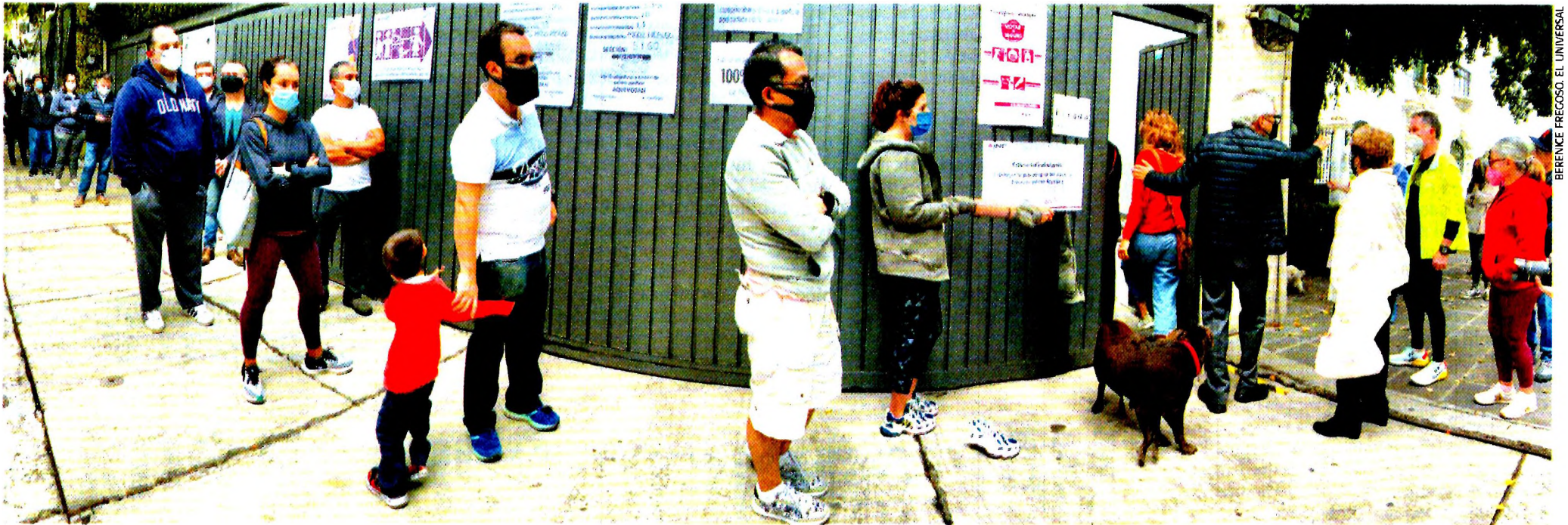
Largas filas se registraron en las casillas en las que los ciudadanos acudieron a votar respetando las medidas sanitarias contra el Covid-19, como el uso de cubrebocas y la sana distancia.

No consiguen el número de legisladores necesario para hacer reformas a la Constitución. La coalición del PRI, PAN y PRD festeja que le arrebató poder en la Cámara de Diputados a la autollamada Cuarta Transformación . Participación ciudadana en los comicios fue superior a 51.7%