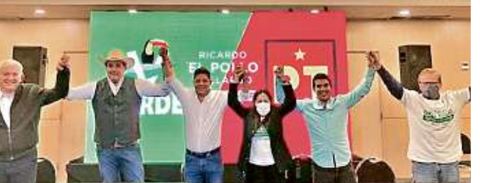
Ricardo Gallardo, San Luis Potosí, del Partido Verde.