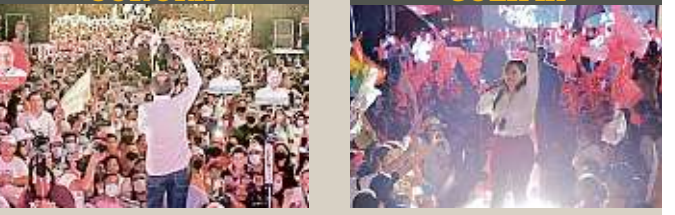
Alfonso Durazo, de Morena