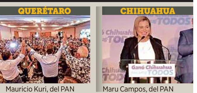
Mauricio Kuri, del PAN