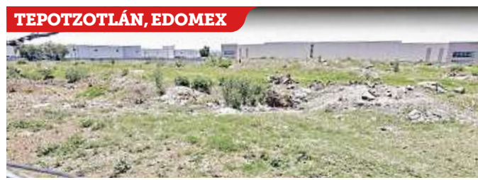
Los hospitales cancelados no comenzaban a construirse.

INGRESO DISPAREJO El ingreso promedio trimestral por hogar en México es de 53 mil 12 pesos, pero no todos los hogares reciben lo mismo. Conoce las diferencias entre cada familia. reforma.com/ingresos