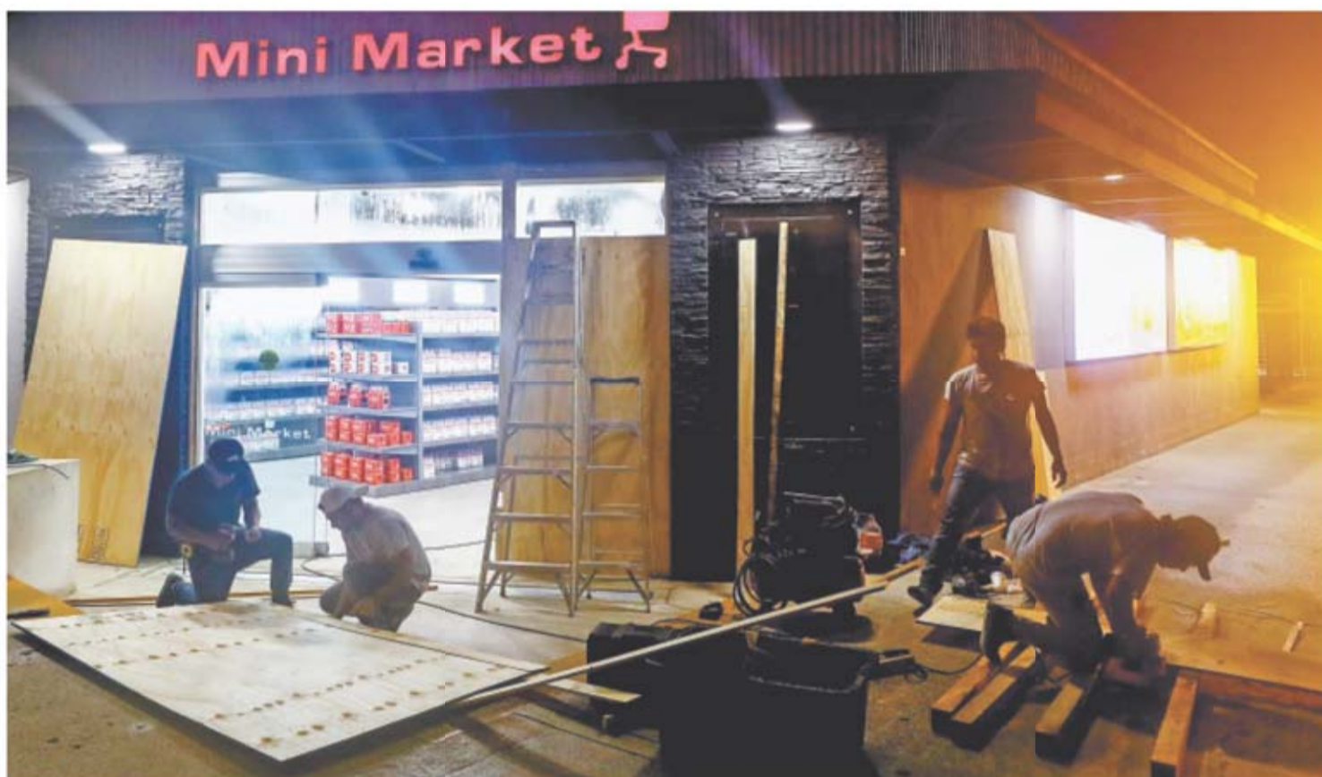
DIEGO SAINZ SANCHEZ, EL UNIVERSAL

Quintana Roo. — La entidad se encontraba ayer en alerta roja ante la llegada del huracán. Se esperaba que toque tierra en las primeras horas de hoy. Comercios y casas fueron protegidos con maderas. En Cancún, más de 30 mil turistas fueron llevados a refugios. El gobierno federal anunció el despliegue de 5 mil elementos para el Plan DN-III. | ESTADOS | A12