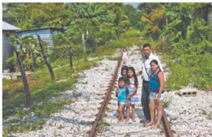
DIEGO PRAO, EL UNIVERSAL

Familias llevan años viviendo en los márgenes de las vías ferroviarias, por las que ahora se contempla que transite el Tren Maya, emblema de la 4T.