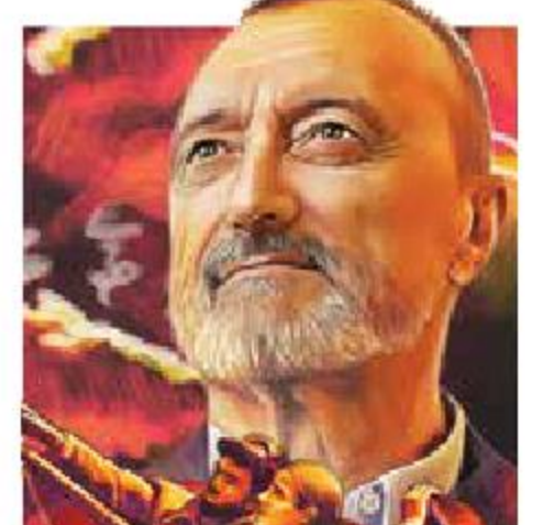
Ilustración: Jesús Sánchez