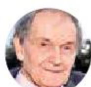
Roger Penrose (Reino Unido)