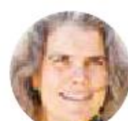
Andrea Ghez (Estados Unidos)