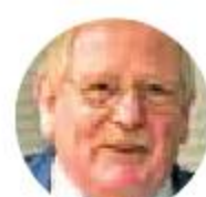
Reinhard Genzel (Alemania)