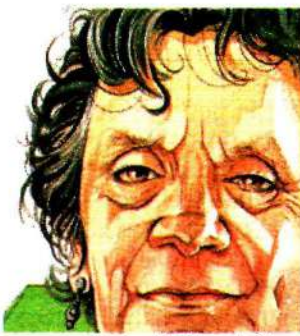
Ilustración: Horacio Sierra