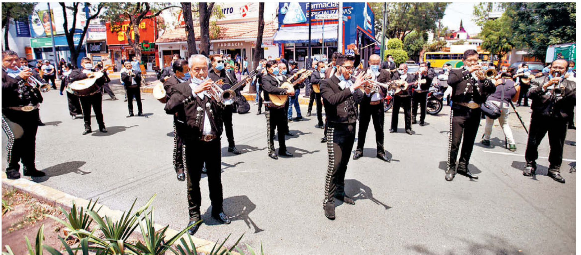
Un grupo de mariachis llevó serenata al personal médico y a pacientes del Instituto Nacional de Enfermedades Respiratorias de la capital.