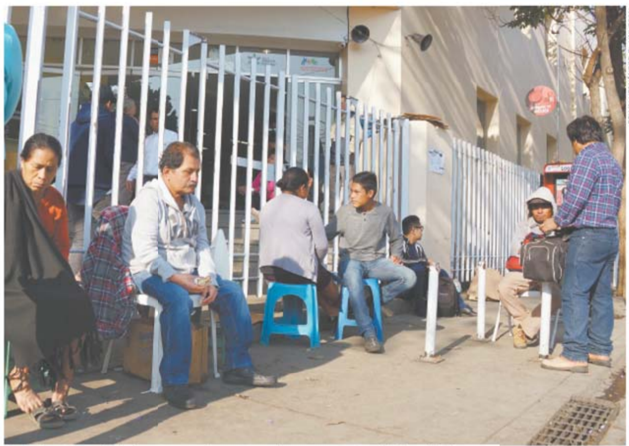
El desabasto es principalmente en medicamentos e insumos para atención hospitalaria, pero anestésicos y medicinas para terapia intensiva y urgencias empiezan a escasear. El Hospital Civil Dr. Aurelio Valdivieso es de los afectados.