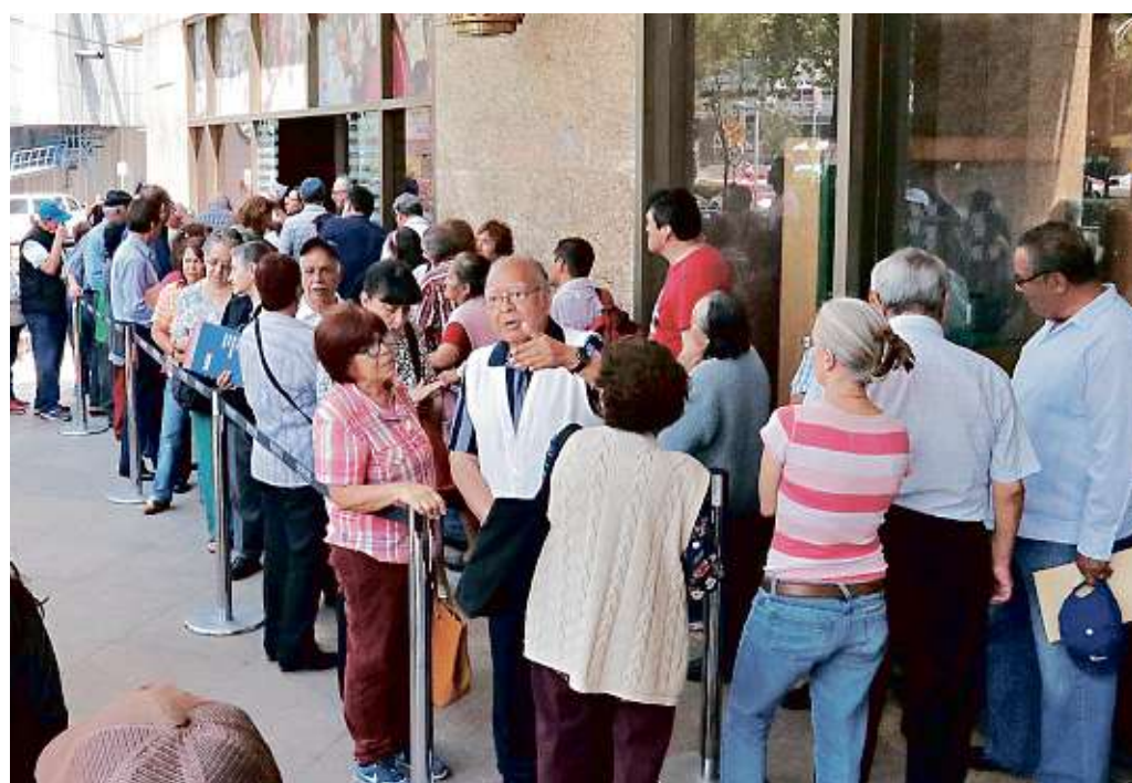
Cientos de adultos mayores hacen fila todos los días frente a la Secretaría del Bienestar.