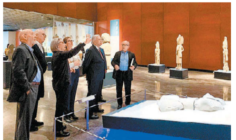
Visitó el Museo Nacional de Antropología.