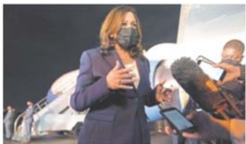
Kamala Harris, en Ciudad de Guatemala, ayer.

La vicepresidenta de EU hablará hoy de migración y otros temas con el presidente López Obrador.