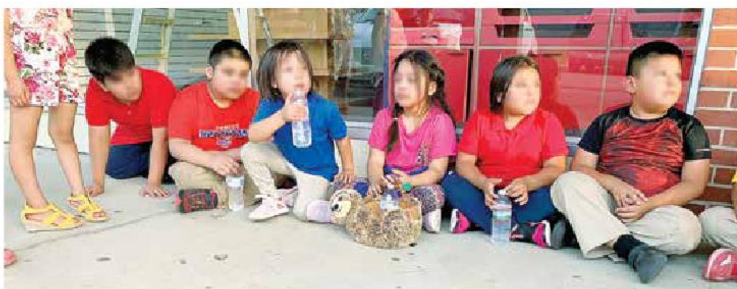
Los hijos de algunos migrantes detenidos se quedaron solos en las calles. Los vecinos los tranquilizaron y les proporcionaron alimentos y bebidas. Luego los llevaron a un gimnasio local para que pasaran la noche.