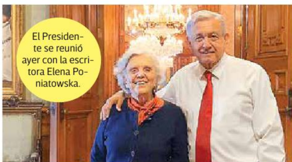
El Presidente se reunió ayer con la escritora Elena Poniatowska.