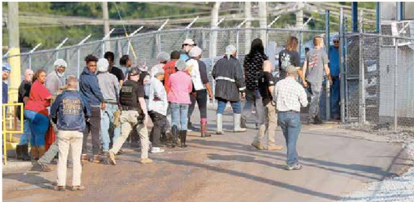
Los agentes del ICE rodearon varias plantas de procesamiento de alimentos ubicadas en Morton para evitar que los indocumentados escaparan. Los detenidos serán procesados por violar leyes migratorias.