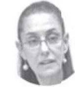
CLAUDIA SHEINBAUM Jefa de Gobierno de la CDMX

La jefa de Gobierno, Claudia Sheinbaum, dijo que esto se debe a que aumentó el número de pruebas para detectar pacientes en estas demarcaciones y precisó que será la Secretaría de Salud federal la que decida si se regresa o no al semáforo rojo.