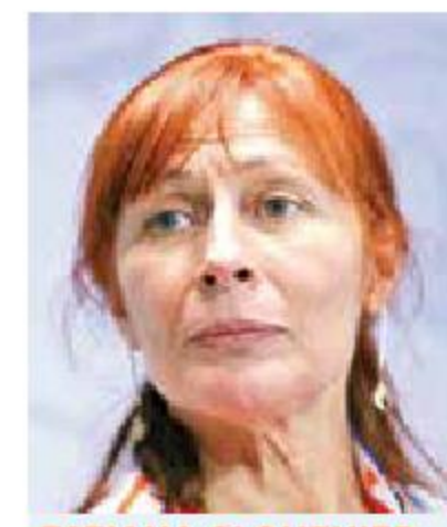
TATIANA CLOUTHIER SECRETARÍA DE ECONOMÍA

Éstas son las cinco mujeres propuestas por el Presidente para ocupar cargos públicos de alta responsabilidad.