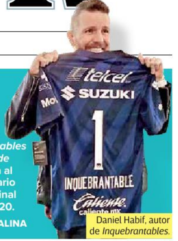
Daniel Habif, autor de Inquebrantables.