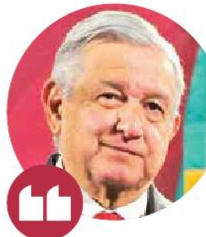
ANDRÉS MANUEL LÓPEZ OBRADOR PRESIDENTE DE MÉXICO