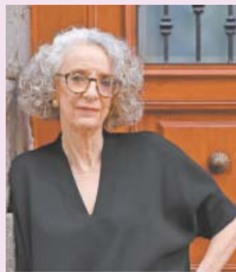
BERENICE FRECOSO, EL UNIVERSAL

● Miles marcharon en Madrid, donde mexicanas se dijeron hartas de la violencia de género. Hubo protestas en otros países, pero el Covid-19 obligó a frenar algunas de ellas. A18