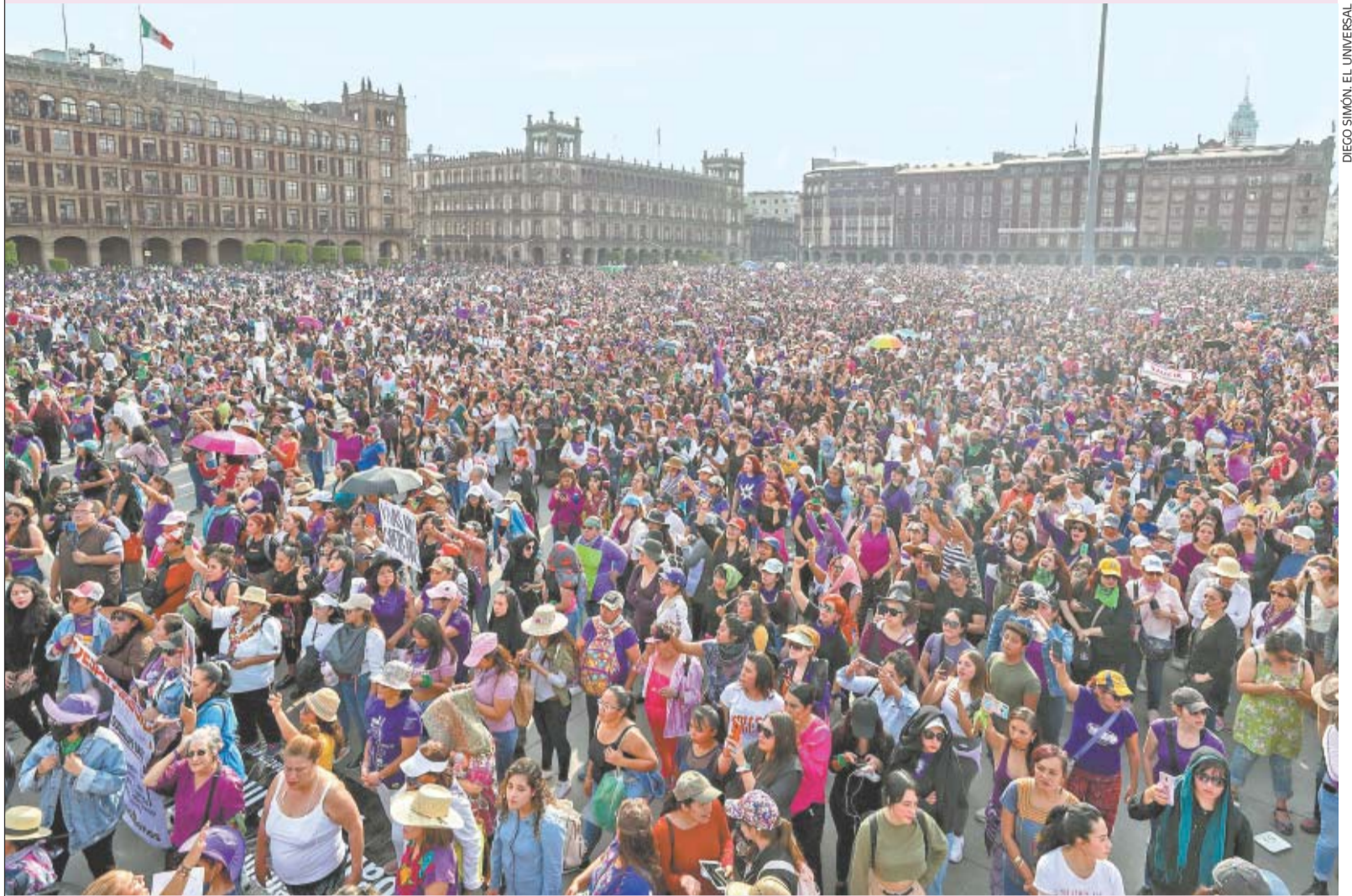
DIEGO SIMÓN, EL UNIVERSAL

Miles de mujeres marcharon desde el Monumento a la Revolución hasta la plancha del Zócalo para exigir el fin de la violencia de género.