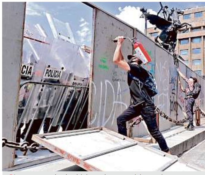
Los encapuchados hicieron lo que quisieron sin que la policía los frenara.

El inicio del juicio contra Torres estaba programado para el 22 de junio y en él enfrentaría las acusaciones de lavado de dinero y dos modalidades de fraude a bancos estadounidenses por las transferencias hechas en 2008, las cuales fueron a pa-