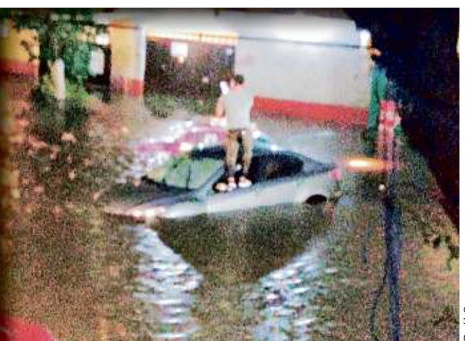
El granizo tapizó parte del Zócalo capitalino y en algunas colonias, como La Ajusco (foto), colapsó el drenaje.

MARTES 9 / JUNIO / 2020 CIUDAD DE MÉXICO