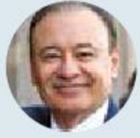
Alfonso Durazo Gobernará Sonora

De 20 senadores que compitieron por un nuevo puesto, nueve lograron el triunfo: seis de ellos serán gobernadores y otros tres, presidentes municipales. / 4