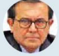
Ildefonso Guajardo Fue exsecretario de Economía y negoció el T-MEC. Postulado por el PRI