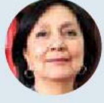
Amalia García Medina Exlideresa nacional del PRD; también gobernó Zacatecas. Postulada por MC