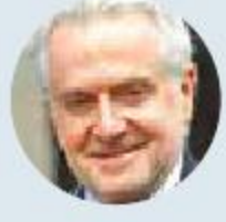
Santiago Creel Miranda Fungió como secretario de Gobernación; exsenador. Postulado por PAN-PRI-PRD

Personajes con una historia destacada en la vida política nacional tienen asegurada una curul federal a través de la vía plurinominal. / 5