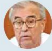
Rubén Rocha Gobernará Sinaloa