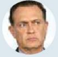
Mauricio Kuri Gobernará Querétaro